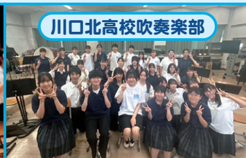
川口北高校吹奏楽部