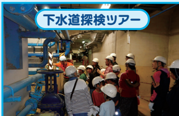
下水道探検ツアー