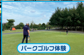
パークゴルフ体験