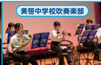
美笹中学校吹奏楽部