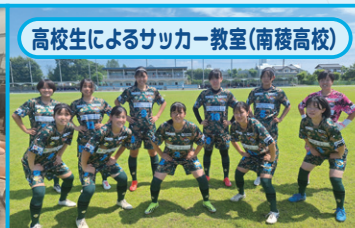
高校生によるサッカー教室(南稜高校)