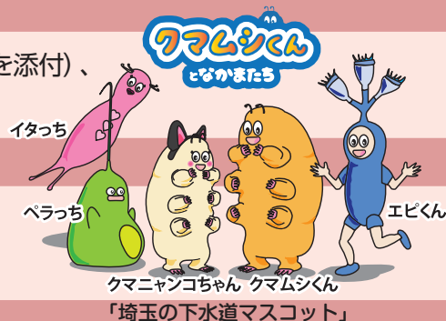
「埼玉の下水道マスコット」

公益財団法人埼玉県下水道公社 埼玉 150 周年記念マンホールデザインコンテスト担当